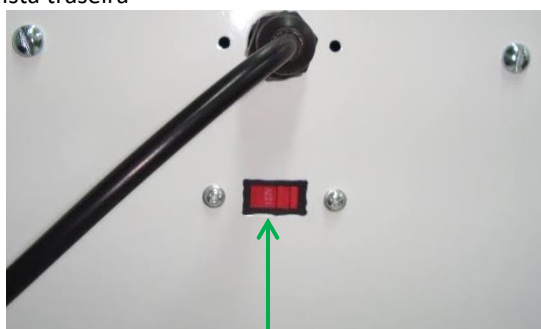
Chave seletora de tensão