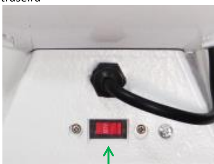
Chave seletora de tensão